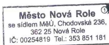
Jitka Pokorná starostka města Nová Role